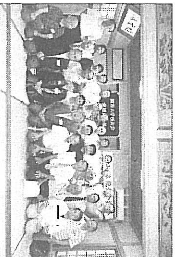
平成26年度総会集合写真